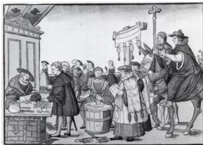
Imagem 3- Fonte:

Caro aluno, você frequenta alguma Igreja? Se não frequenta, certamente conhece alguém que frequenta, não é verdade? Provavelmente você ou alguém que você conhece, ou até mesmo alguém de sua família, costuma ir à Igreja. É uma prática muito comum e difundida no nosso país desde os tempos mais remotos. Tanto que, é bem provável que você conheça pessoas que frequentem igrejas das mais diversas, como por exemplo a Metodista, a Batista, a Universal do Reino de Deus... Mas, você sabia que até o século XVI, a única Igreja Cristã que existia era a Católica? As Igrejas Protestantes, genericamente conhecidas no Brasil como “Evangélicas,” só começam a surgir a partir desse século.