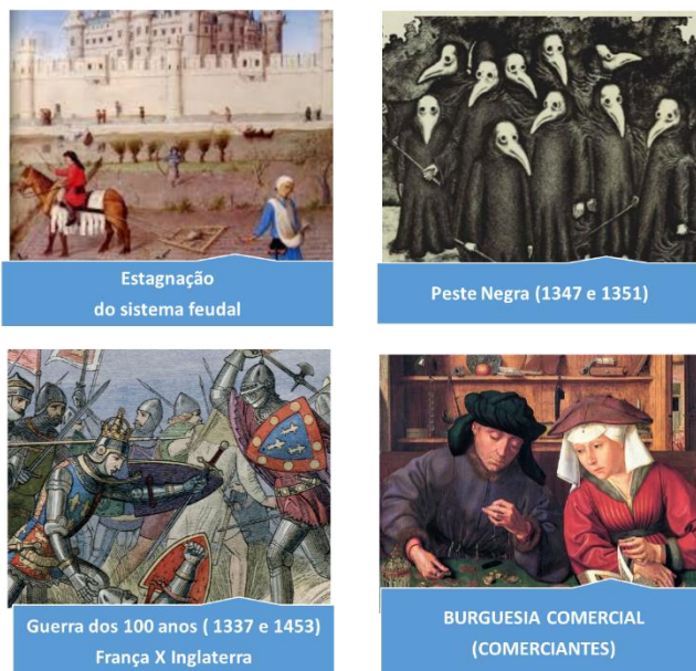
Imagem 1

Para piorar a situação, o início do século XIV foi arrasado por intensas chuvas, que diminuíram ainda mais as colheitas, aumentando a fome. Mas, as chuvas não trouxeram apenas fome à população, trouxe também o risco de doenças. E, de fato, uma epidemia de Peste Bubônica, causada pela urina de rato, se espalhou por toda Europa: chamada também de Peste Negra.