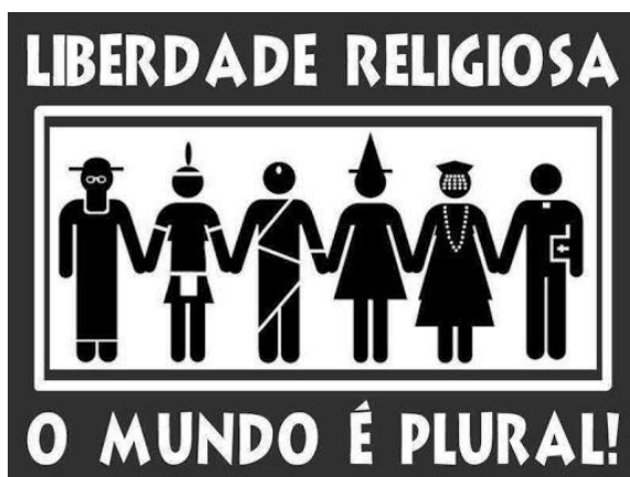
Imagem 8- Fonte: http://morad.com.br/a-liberdade-religiosa-e-o-direito-a-vida/

1 – o que significa um mundo religiosamente plural como representado na imagem?