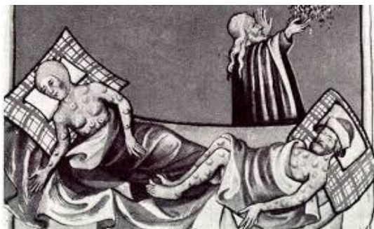
Imagem 10- Fonte: http://morad.com.br/a-liberdade-religiosa-e-o-direito-a-vida/