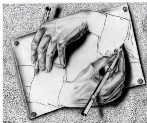
Figura 4. Drawing Hands, 1948. Maurits Cornelis