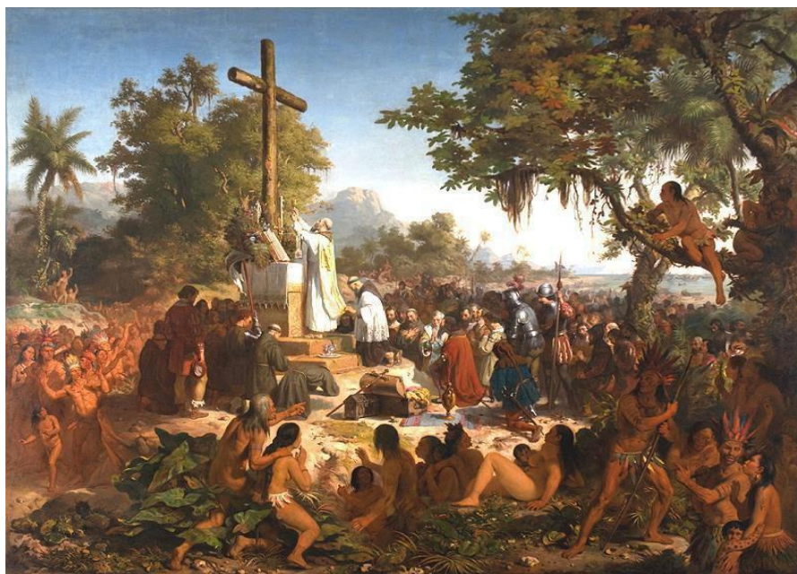
Figura 2. Primeira missa do Brasil.(Victor Meirelles - 1860).