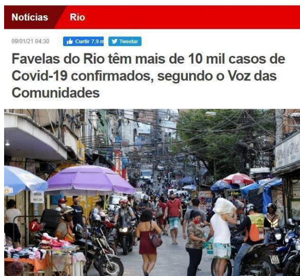
Figura 3. Matéria por Felipe Grinberg

“Levantamento do portal “Voz da Comunidades” mostra que as favelas cariocas ultrapassaram a marca dos 10 mil casos confirmados de Covid-19, além do registro de 964 mortes pela doença. As tristes estatísticas em comunidades devem ser ainda maiores, já que esses números são referentes a apenas 25 comunidades. A prefeitura só divulga os casos de específicos daquelas que são consideradas bairros, como a Maré, o Complexo do Alemão e a Rocinha. [...]” (trecho da matéria)